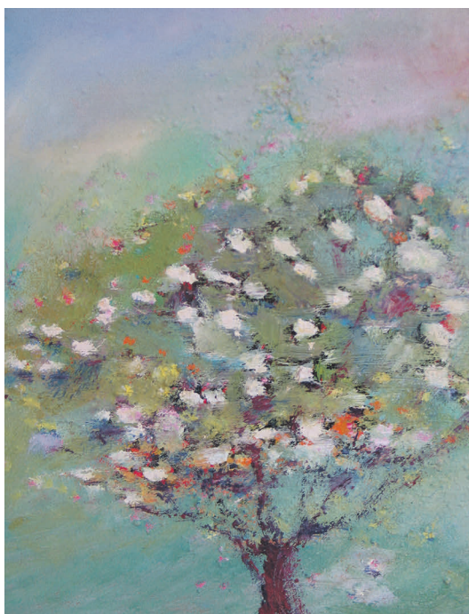
“Det blomstrende træ”